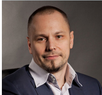
CEO, Sergey Ustimenko

Under 2014 förvärvade Auriant Mining Centerras andel och blev på så sätt ensam ägare av fyndigheterna och började arbetet med att bekräfta reserverna i Kara-Beldyr. Enligt villkoren i förvärvsavtalet ska Auriant till Centerra betala en NSR-royalty (Net Smelter Royalty) på 3,5 procent på all framtida mineralproduktion från Kara-Beldyr-fyndigheten.